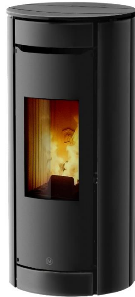
BOTERO 2 Advanced