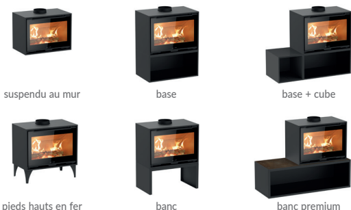
suspendu au mur