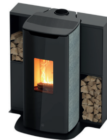
Miro T-win avec T-win Box