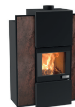
Serie S Foghet Evo Aria