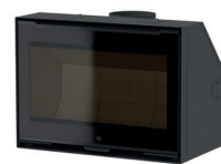
Vitre Black Shady

62 4,9-8,6 kW 68 4,9-9,7 kW 80 5,2-11 kW 90 6-10,6 kW