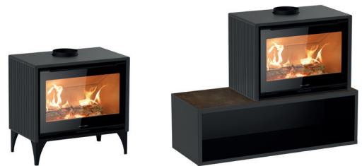
Quadro+ Ceramic avec pieds en fer